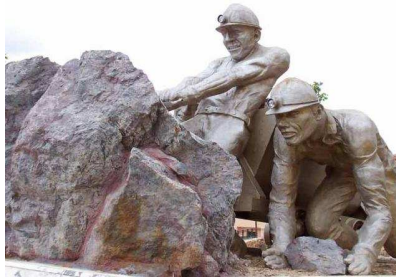
MONUMENTO AL MINERO

(Programa: Caminamos por nuestros senderos y nuestros pueblos 2018) (RUTA URBANA ALMADEN)